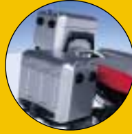
Set valigie alluminio.

Robuste, amovibili, dotate di serratura dispongono di una capacità totale di ben 104 litri.